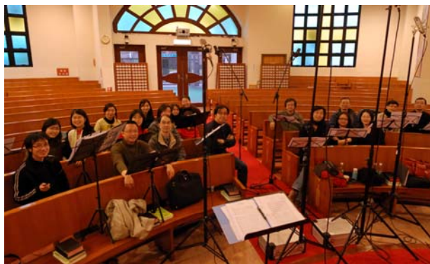
←香港聖詠小組全體組員。